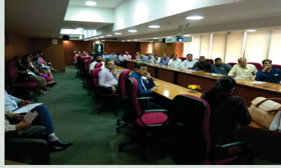
બેંક ઓફ બરોડા, ઝોનલ ઓફીસ, અમદાવાદ