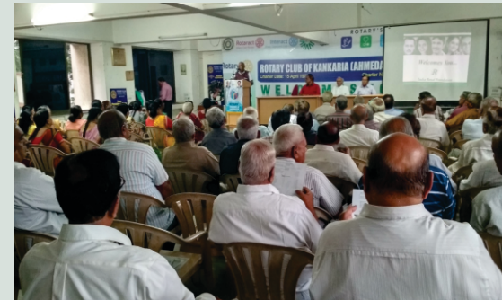
સિનિયર સિટીઝન ક્લબ, ઘોડાસર