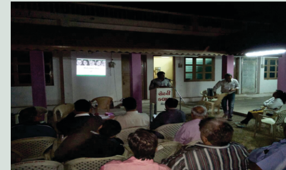
રોટરી ક્લબ ઓફ મોરબી