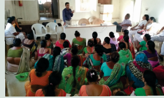
પ્રાથમિક આરોગ્ય કેન્દ્ર, ઉવારસદ ગામ