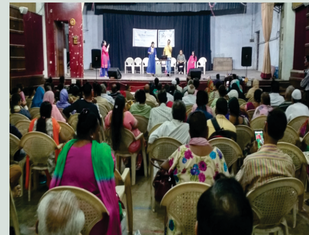
મ્યુઝિકલ કાર્યક્રમ, અમદાવાદ

પ્રેરણા કિડનીના દર્દીઓ માટે વર્ષ ૨૦૦૨ થી ચલાવવામાં આવતો પુનઃવસન કાર્યક્રમ છે. આ કાર્યક્રમનો હેતુ કિડનીના દર્દીઓને શિક્ષિત કરવાનો, માનસિક અને ભાવનાત્મક સ્થિરતા આપવાનો તેમજ દર્દીના જીવનની ગુણવત્તા સુધારવાનો છે.