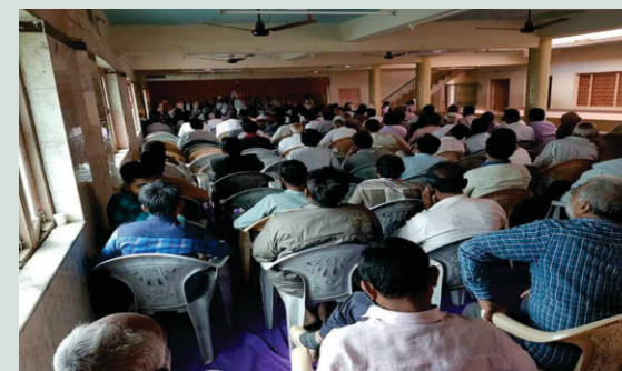
સિંધી સમાજ, ભાવનગર